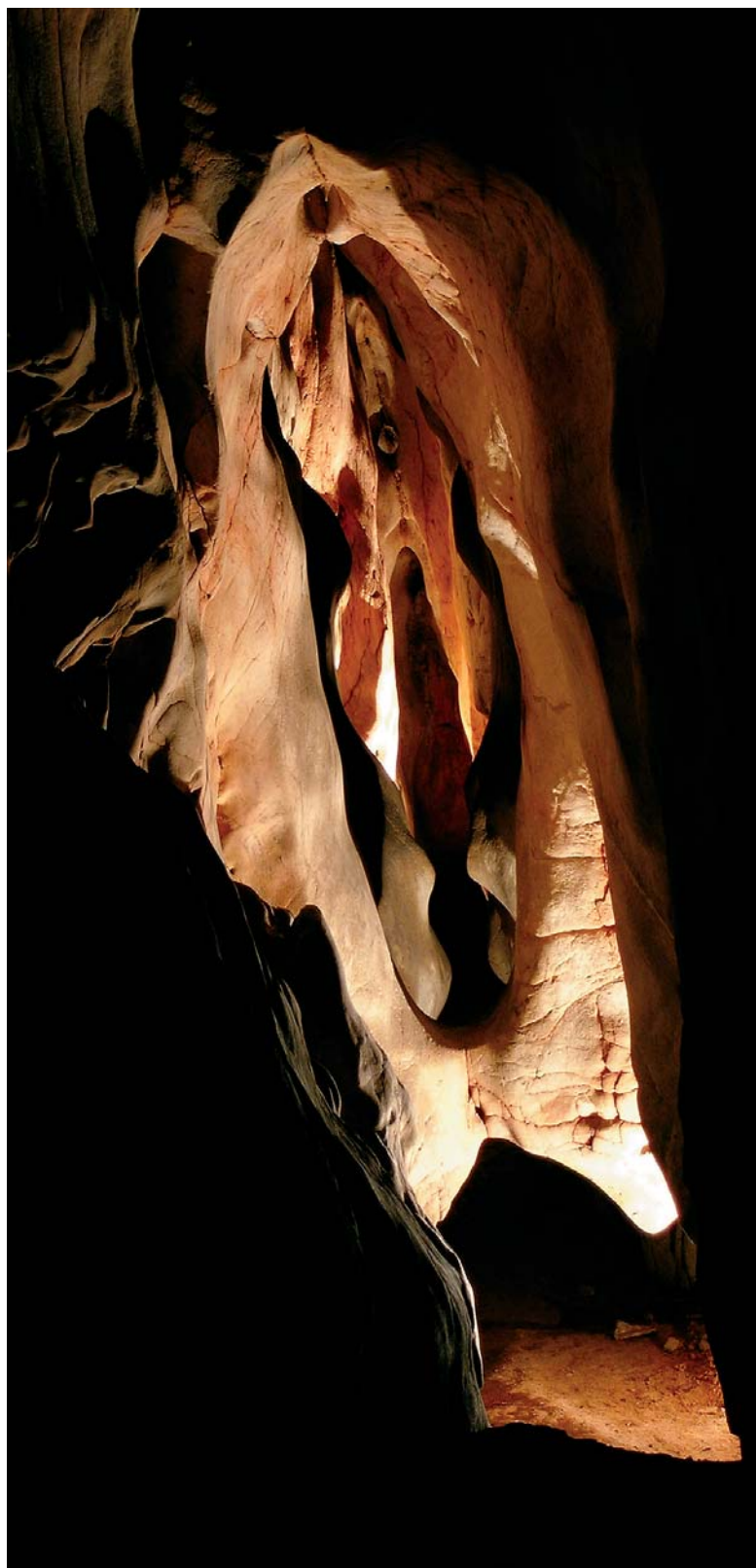
„Lúno Matky Země“ v jeskyni Domica. Jednalo se pravděpodobně o centrální kultovní prostor lidí bukovohorské kultury. Kúlové jamky ukazují, že prostor byl částečně zakryt. Na stěnách byly nalezeny nejdokonalejší geometrické kresby v celé jeskyni, zadní část ústí k podzemní řece „Styx“. Celý tento podzemní objekt můžeme považovat za nejlépe zachovanou pravěkou svatyni na území Slovenska.

Za tajemství krasu obvykle považujeme to zjevné a viditelné - kam se vody propadají, kudy pokračuje jeskyně, jak vznikají propasti, co nám říkají jeskynní výplně. Ale možná u jádra všech těchto vcelku vědeckých otázek a dobrodružných speleologických akcí stojí právě touha přebývat v blízkosti posvátného tajemství a občas se jej moci dotknout.