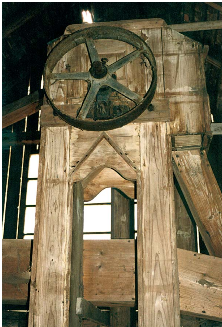
Vnútorné zariadenie vodného mlyna je ešte v dobrom stave.

problém riešiť elektrifikáciou obce. V mlyne nainštalovali dynamo, ktoré poháňalo jedno z mlynských koles. Svojím výkonom bolo schopné rozsvietiť asi 100 žiaroviek. Pre nekvalitné rozvody žiarovky svietili iba slabo. Po piatich rokoch prevádzky sa združenie rozpadlo a celé zariadenie elektrárne aj s rozvodmi predali. Onedlho nato mlyn spustol. Použiteľný materiál panstvo odviezlo, a tak z mlyna