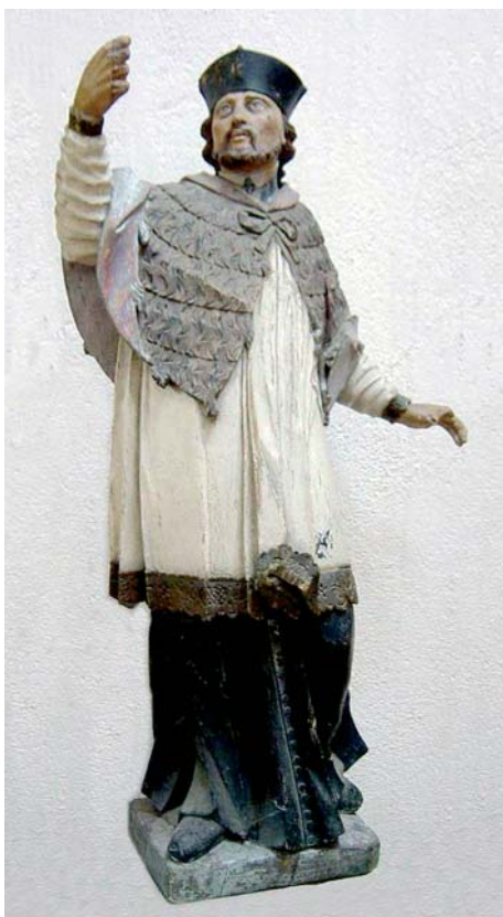
Drevená socha svätého Jána Nepomuckého.

Panny Márie. Pravdepodobne túto kaplnku dal Dionýz Andrassy v roku 1895 prestavať.