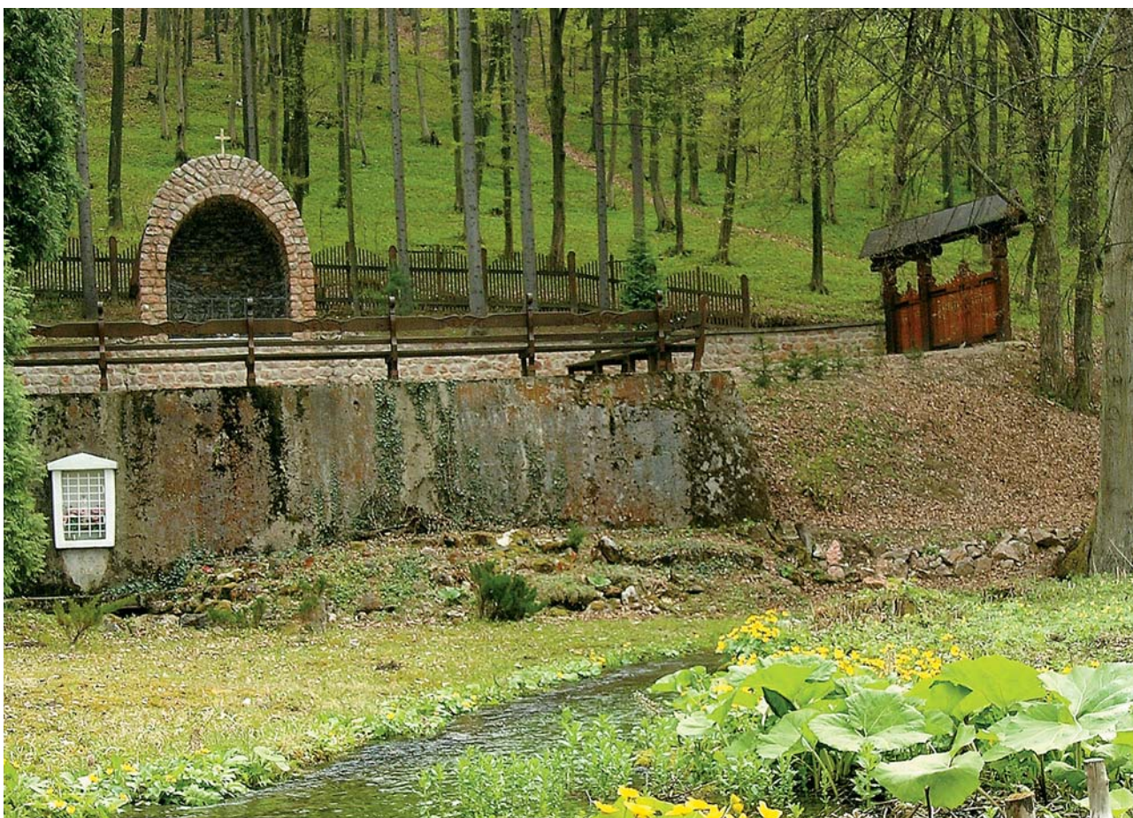
Rekonštruovaný areál kaplnky Buzgó.