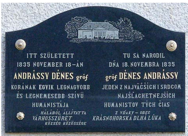
Pamätná tabuľa na budove školy - bývalý kaštieľ Andrassyovcov.