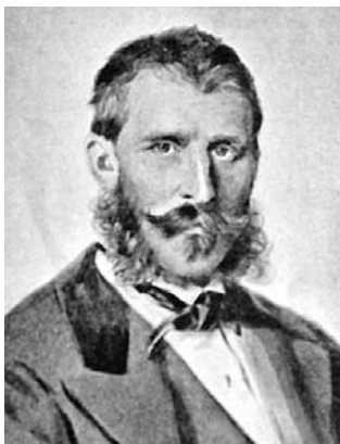
Gróf Dionýz Andrassy

S obľubou sa zdržiaval vo svojom sídle v Krásnohorskej Dlhej Lúke, ktoré však po kossúthovskom povstaní za nezávislosť Maďarska osirelo. Prízemná budova postavená